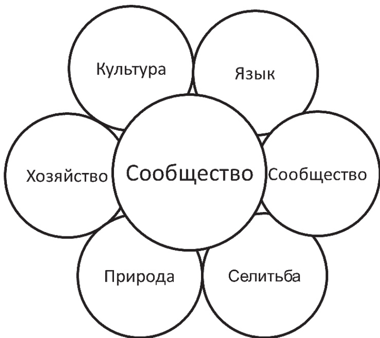
Рис. 1. Исследовательская модель культурного ландшафта [Калуцков 2008]