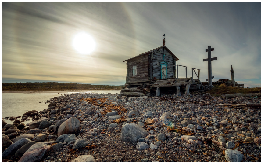
Рис. 3 Тоня – часовня «Кярженица» (д. Летний Наволок). 2018 г.