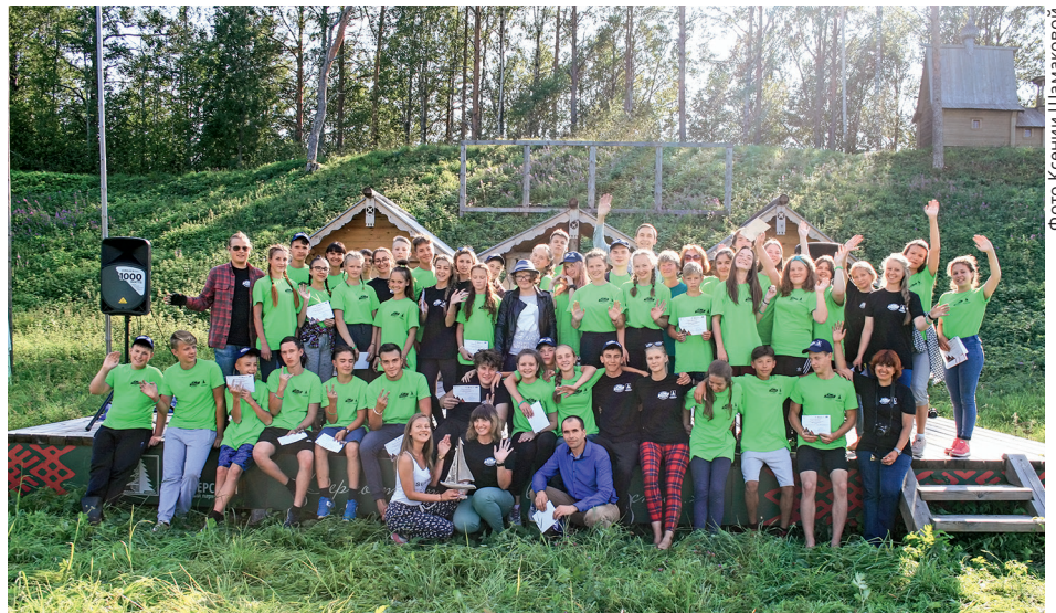
Фото Ксении Шамаковой

В этом году для участия в профильных сменах Кенозерского национально-парка слетелись ребята из разных уголков России: Архангельск, Вологда, Москва, Санкт-Петербург, Череповец, Переславль-Залесский, Нижний Новгород, Казань, Тула, Воронеж, Сочи, Крым, Брянск, Челябинск, Владивосток, Екатеринбург, и, конечно, из населённых пунктов национальных парков «Кенозерский» и «Онежское Поморье».