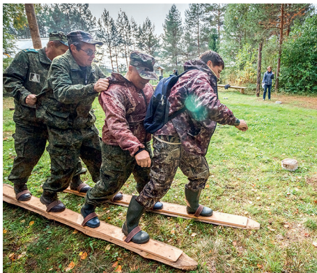
Командный забег на лыжах

В результате упорной, захватывающей борьбы в общем командном зачёте победителями стали сотрудники Плесецкого сектора Кенозерского национального парка. Серебро досталось команде «Онежского Поморья». Почётное третье место заняла команда Каргопольского сектора Парка. Награждение победителей состоялось на торжественном ужине в трактире «Почтовая гоньба». Поздравить сотрудников национальных парков приехал музыкальный коллектив «Эстрада» из города Архангельска.