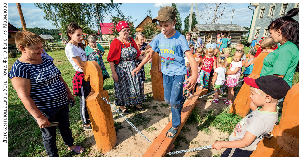
Детская площадка в Усть-Поча.

В марте этого года жители деревень и посёлков Кенозерья и Онежского полуострова приехали на семинар «10 шагов к успешному проекту» с идеями, а уехали с готовыми проектами. Большая часть из них получила финансовую поддержку Парка и партнёров. В конце ноября закончилась их реализация, и пора подвести итоги.