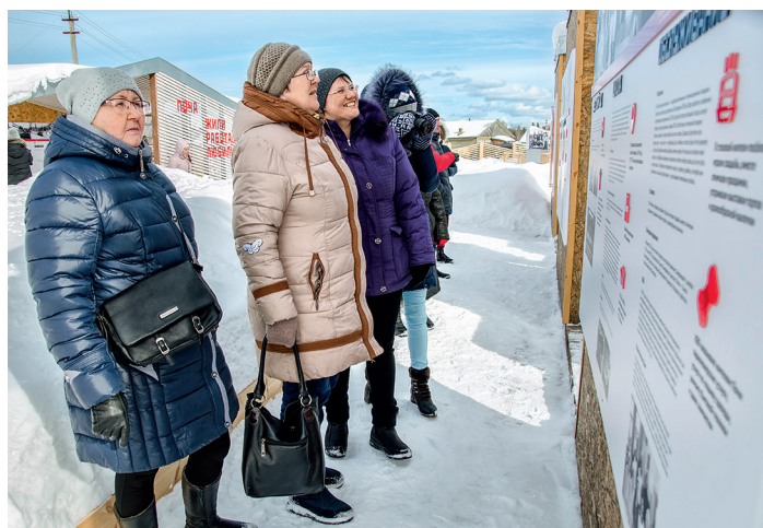
Программа «Поча XX век».

• Большой популярностью пользуется программа «Поча XX век». Почти 400 гостей стали её участниками в этом году.