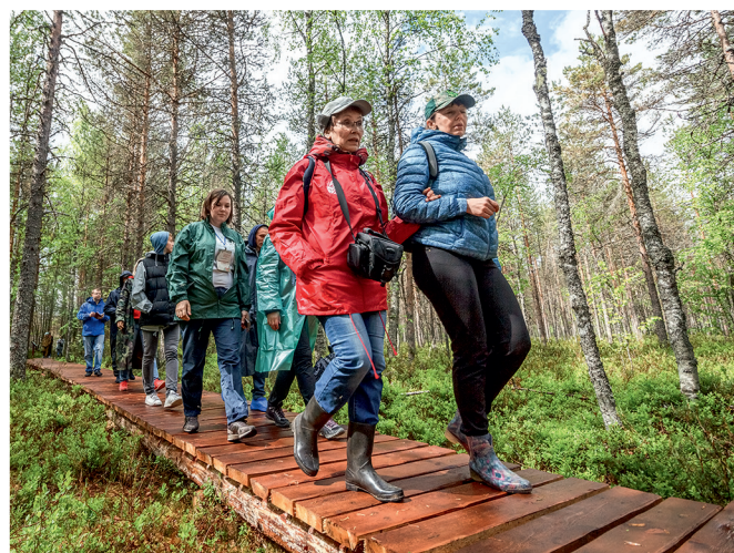
Экскурсия по «Тропе мурaveйников». Фото Евгения Мазилова