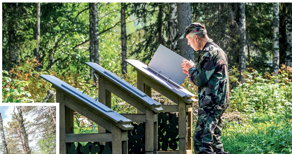
Новая экологическая тропа «Тропа старца Кирилла».

Пройтись по таинственному кенозерскому лесу — теперь для этого ещё больше возможностей: обустроены две новые экотропы и одна обновлена.