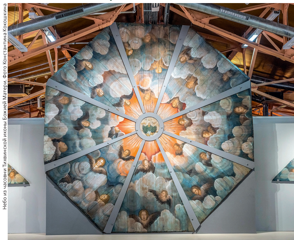
Небо из часовни Тихвинской иконы Божией Матери

«На юбилейной выставке в Центре имени Грабаря показывают отреставрированное «небо» из часовни Тихвинской иконы Божией Матери, что расположена в деревне Хвалинская на территории Кенозерского национального парка. Выставка «Век ради вечного» — главное событие юбилейного года, в котором Всероссийский художественный научно-реставрационный центр имени И.Э. Грабаря отмечает столетие. А расписные «небеса» конца XVIII века из Кенозерского национального парка — её главный экспонат», — так в конце сентября сообщили многие центральные телеканалы и печатные издания об открытии в Москве выставки «Век ради вечного».