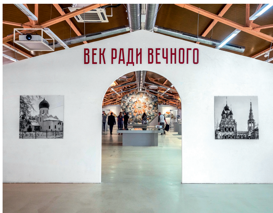
Выставка «Век ради вечного»

«Небо» для часовни Тихвинской иконы Божией Матери деревни Хвалинская, расположенной на берегу озера Лекшмозеро, было написано в конце XVIII века. Его иконография уникальна: почти всё пространство восьми граней занимают кучевые облака с херувимами, а в центральном медальоне — благословляющий Саваоф. Живая компоновка, разнообразие поворотов и ракурсов, цветосветовая моделировка и колорит — эти особенности напоминают о плафонной живописи ка-