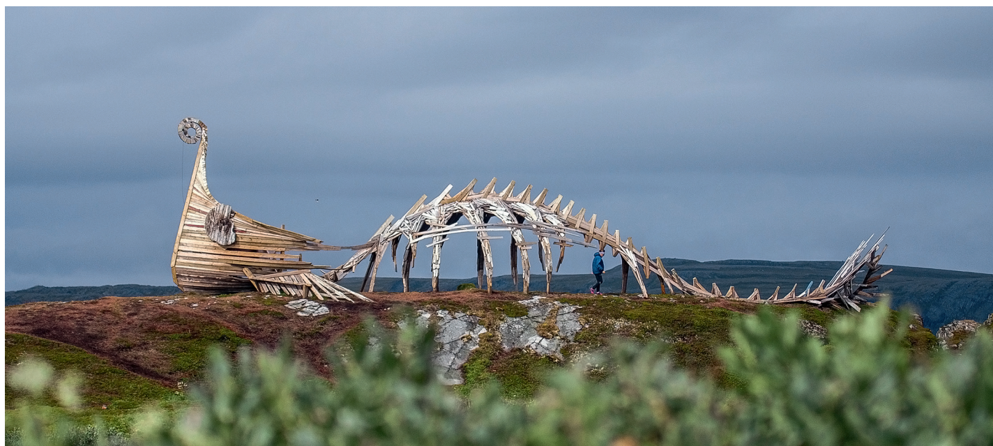
«Дракар» — это живая история, которая развивается сама и развивает норвежский город Вардэ

Привлекает отношение к художникам и подход к организации всего, что происходит под эгидой Кенозерского национального парка. Достойная подача информации, графический дизайн, реставрационные работы, образовательные программы, фестивали и многое-многое другое — в Кенозерье не заскучаешь! Бывая в главном офисе национального парка, я понимаю, что здесь работают неравнодушные люди, готовые взять ответственность и инициировать что-то новое на своей территории, довести дело до конца. Далекое не все госучреждения имеют такие качества, к сожалению. ■