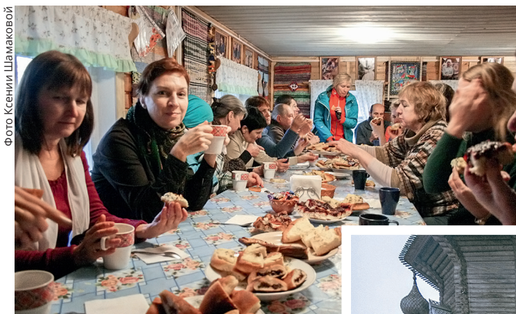
Пирогами с рябиной, брусникой, толокном, грибами и картофелем угощали гостей семинара местные жители

Нужна ли национальным паркам Летопись природы? Актуальна ли