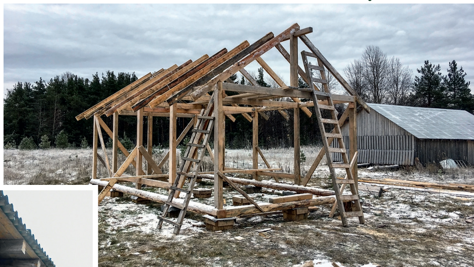
Птицы на заповедной территории.

Уже сегодня полным ходом идёт строительство ангара — помещения для удобной и качественной работы по лодкостроению. Важно, что активную помощь в строительстве этой мастерской оказывают сами дети — участники проекта