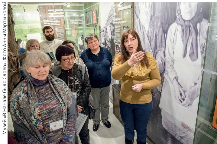
Музей «В Начале было Слово».

• Только за 3 летних месяца в наших кафе-гостиных обслужили 2326 человек , что на 30% больше, чем в 2017 году.