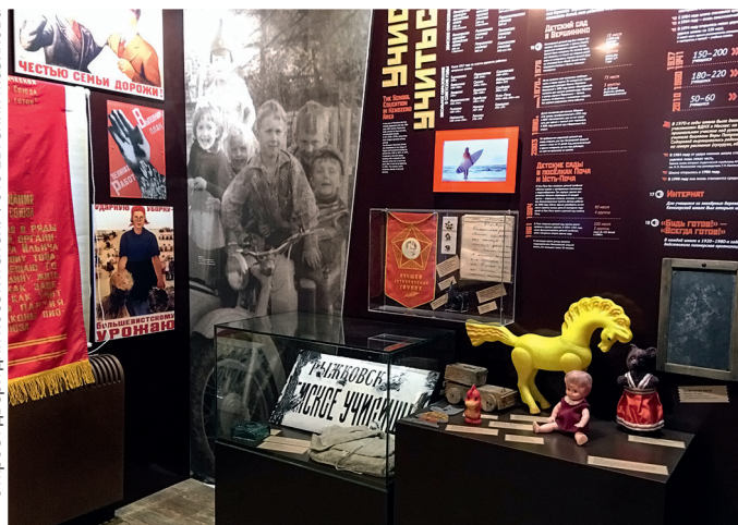
Экспозиция «Хроники памятного и обыкновенного» скоро откроет двери для посетителей.