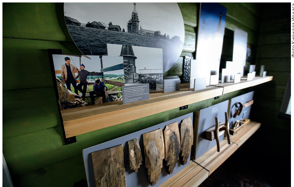
Экспозиция в притворе церкви Обретения главы Иоанна Предтечи

демонстрируются материалы о консервации и реставрации храмового ансамбля Почезерского погоста. Здесь представлены фотографии 1980-х гг., сохранившие память о студенческом реставрационном отряде « Атеист » (Архангельский Педагогический институт имени М.В. Ломоносова), снимки начала 2000-х гг., фиксирующие реставрацию Почезерского погоста, осуществляе-