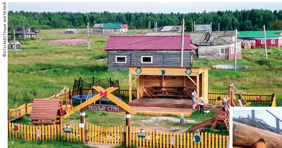
ФОТО МЕСТНЫХ ЖИТЕЛЕЙ

«Тёплый стан» — название связано с традиционным промыслом жителей — рыболовством и заготовкой водорослей. На станах (отсюда название) проводили много времени — здесь косили, сушили водоросли.