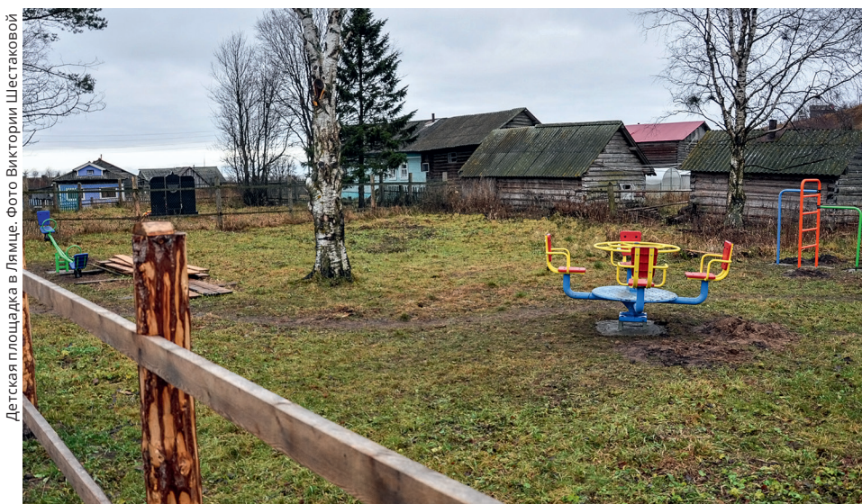
Детская площадка в Лямце.

Тел.: +7(8182)28-65-23, e-mail: pr@kenozero.ru Светлана Марич начальник отдела социокультурной деятельности